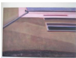
Regine Pustan: Fassade

Unter dem Titel Figurationen fasst Birgitt Fuchs Arbeiten zusammen, die die menschliche Figur in Bewegung thematisieren. Sie nutzt Abbildungen männlicher Körper in einiger weniger Posen, die sie durch Vervielfältigung, Imitation und Verzerrung bis zu Auflösung hin zu Kompositionen zusammenfügt. Das Ergebnis ist ein Konstrukt in dem Körper aus dem realen in einen völlig neuen Zusammenhang transportiert werden und dem Betrachter Eigenschaften wie Interaktion, Kommunikation u. ä. vermitteln ohne dass ihn bewährte Sehgewohnheiten unterstützen.