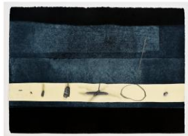
Marga Ebner: Notations

Doris Benkert liebt die klare Linie, die wenn möglich, in einer Gedachten endet. Streifen ziehen sie magisch an. Streifende Gedanken, dazwischen eine Möglichkeit des Findens, des Anhaltens, des Seins.