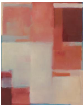
Gabriele Vallentin: Nari 9

Christel Andrea Steiers Innere Landschaften definieren im übertragenen Sinn menschliche Positionen, Prozesse der Entfaltung, Reifung oder Orientierung. Die für diese Serie typischen Horizonte beschreiben imaginäre Landschaften in denen häufig der Eindruck von weiter Landschaft und Wasser entsteht. Während vermeintliche Gebäude Geborgenheit suggerieren, Erdung, Konzentration oder Übereinstimmung meinen, verweisen Wasseroberflächen auf den Spiegel der Seele. Überarbeitete Spuren symbolisieren Erinnerungen, Erfahrungen und Verletzungen. Verfremdet wird die fiktive Landschaft durch eine rillenartige Struktur, die je nach Lichteinfall immer wieder neue Aspekte der Betrachtung zulässt.